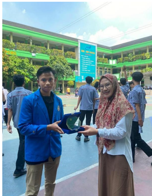
Gambar 6. Penyerahan Plakat