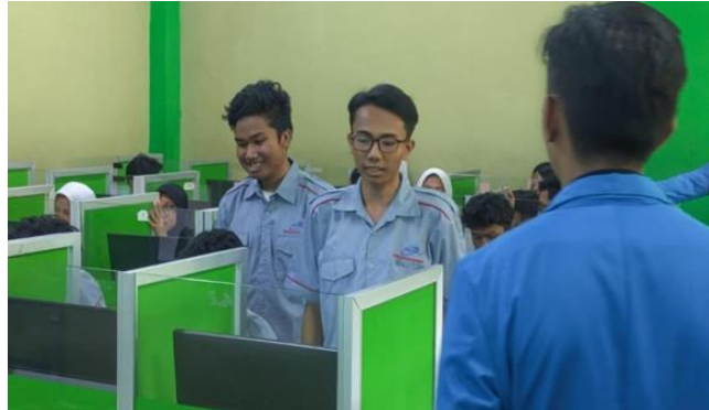
Gambar 4. Quiz