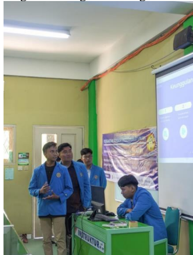
Gambar 1. Pembukaan