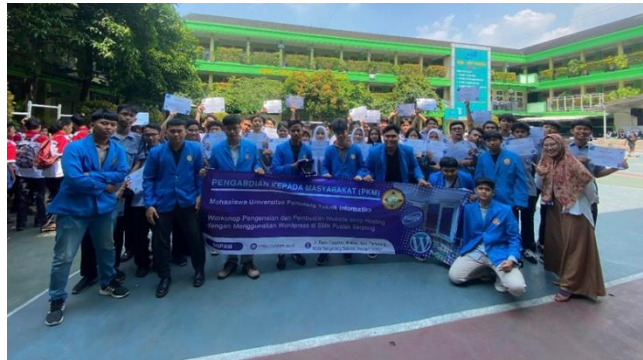
Gambar 5. Foto Bersama