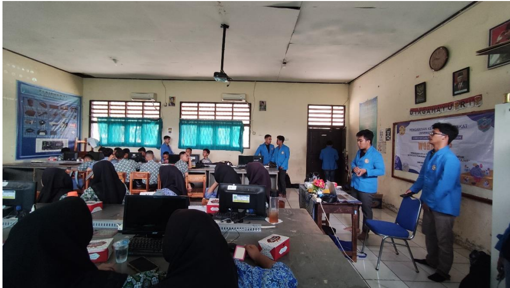
Gambar 3. Proses Demonstrasi beberapa Teknologi Artificial Intelligence

Pada tahap penjelasan materi ini tentunya merupakan tahap yang kami nantikan, yakni menyampaikan materi yang sudah kami rancang dari banyaknya referensi yang ada. Tak lain dan tidak bukan, kami hanya berharap yang terbaik setelah beberapa dampak positif serta dampak negative dari Artificial Intelligence ini dipaparkan, meskipun dominan yang saat ini terlihat seperti yang kita ketahui, dampak buruk selalu menang dari dampak yang baik. Namun hal itu tak mengurangi rasa menyerahnya kami untuk selalu berprasangka baik pada masa yang akan datang.