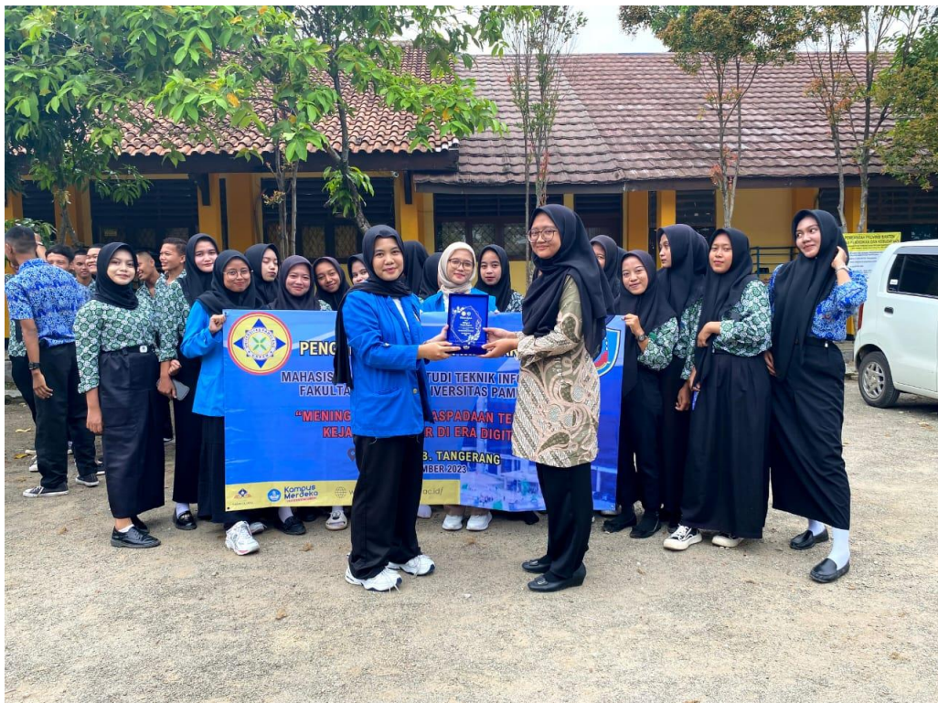
Gambar 4. Penyerahan plakat kepada SMK Negeri 8 Kabupaten Tangerang