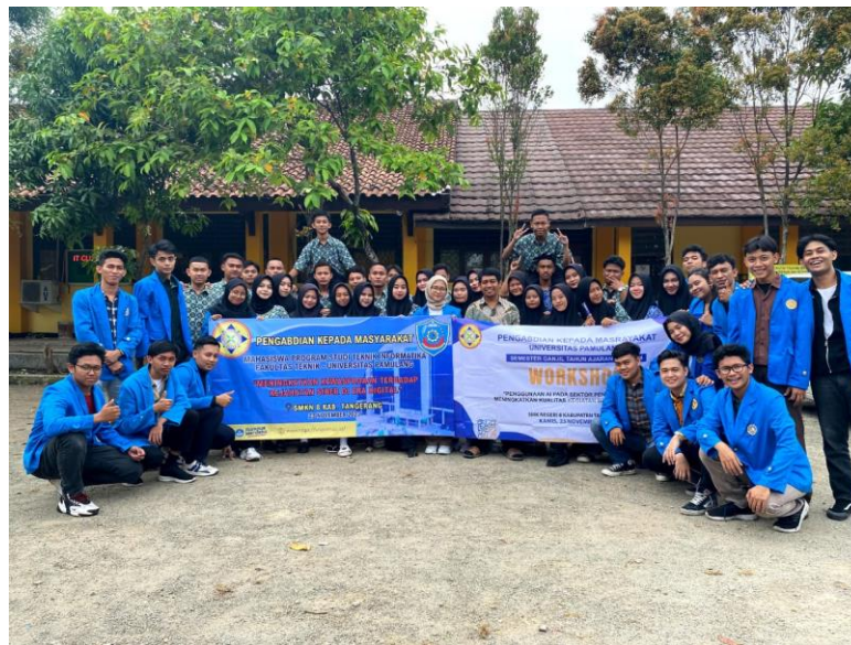
Gambar 5. Foto Bersama Universitas Pamulang dan SMK Negeri 8 Kabupaten Tangerang

Besar harapan kami agar semua ilmu yang kami sampaikan ini diterapkan secara langsung, sebagai bentuk simbolis kami meninggalkan sejumlah kenang-kenangan untuk SMK Negeri 8 Kabupaten Tangerang agar ketika simbolis berupa plakat Kerjasama tersebut di lihat, akan lahir Kembali dorongan kepada para guru-guru disana mengingatkan Kembali kepada para siswanya untuk selalu menggunakan teknologi canggih ini di jalan yang benar supaya tidak tersesat dikemudian hari. Karena kami selaku mahasiswa hanya dapat mengabdikan sejauh ini, dan masa depan terdapat di generasi penerus kami.