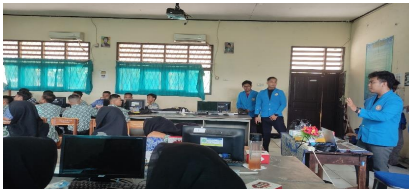
Gambar 2. Penjelasan Materi terkait penggunaan Artificial Intelligence pada sektor Pendidikan

Dengan adanya pengetahuan mengenai Penggunaan Artificial Intelligence ini maka diharapkan agar para siswa-siswi SMK Negeri 8 Kabupaten Tangerang bisa memanfaatkan ilmu nya dan menyebarkan pengaruh positif yang saat ini dimiliki Artificial Intelligence mengingat dampak dari teknologi ini sangat jauh antara positif dan negatif nya. Selain itu kualitas kegiatan belajar mengajar di SMK Negeri 8 Kabupaten Tangerang pun akan semakin meningkat dengan para siswa-siswi yang memahami teknologi Artificial Intelligence ini.