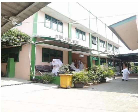
Gambar 1. Lokasi Gedung Bangunan Yayasan SMP Islam Nurul Hidayah

Metode yang digunakan pada kegiatan ini berupa pengenalan dasar-dasar jaringan komputer dengan crimping kabel LAN. Pelaksanaan pelatihan menggunakan tang crimping , Kabel LAN, RJ-45 dan laptop yang akan dilaksanakan di Lab Komputer SMP Islam Nurul Hidayah dengan bimbingan dan pengawasan dari tim PKM. Pelatihan ini berupa presentasi, diskusi serta demonstrasi yang akan dilakukan oleh tim PKM.