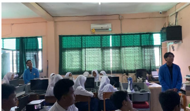
Gambar 3. Pelaksanaan Kegiatan Pengabdian Kepada Masyarakat