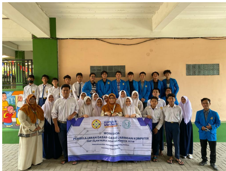
Gambar 5. Foto Bersama Mahasiswa Universitas Pamulang dan Siswa dan Siswi SMP Islam Nurul Hidayah