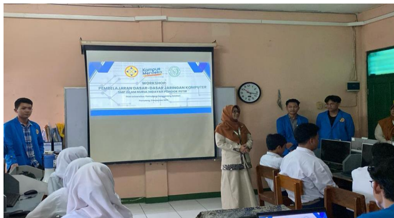
Gambar 2. Sambutan oleh Kepala Sekolah SMP Islam Nurul Hidayah