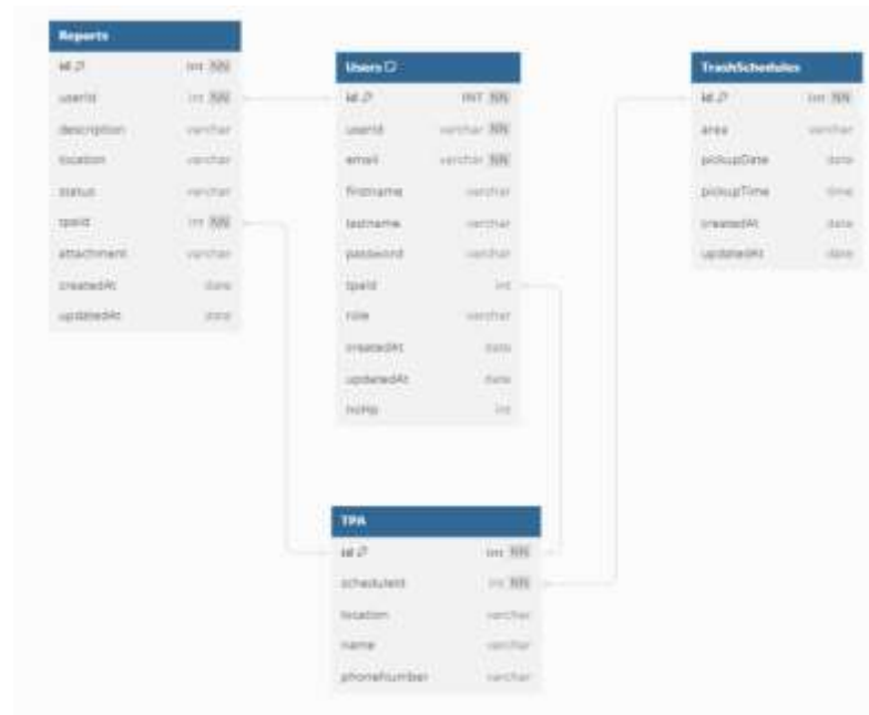
Gambar 3. Class Diagram