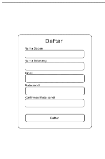
Gambar 5. Halaman Register

Pada halaman ini terdapat formulir pendaftaran pengguna baru, pengguna dapat menginputkan.