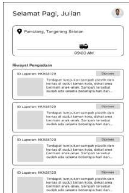
Gambar 8. Halaman riwayat pengaduan

Pada halaman ini terdapat daftar riwayat aduan yang dilakukan oleh pengguna, terdapat juga informasi statusnya.