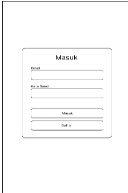
Gambar 4. Halaman Login

Halaman ini digunakan oleh user untuk dapat masuk ke dalam aplikasi dengan memasukkan email dan password akun yang telah didaftarkan sebelumnya. Dan terdapat tombol Register untuk daftar akun.