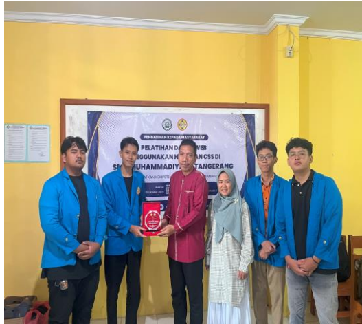
Gambar 5. Peyerahan Plakat PKM.