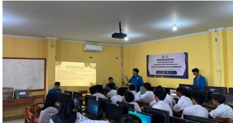
Gambar 2. Penyampaian Materi Kepada Siswa/i SMK Muhammadiyah 02 Tangerang.

HTML digunakan sebagai kerangka dasar website. Siswa diperkenalkan pada elemen-elemen penting seperti: