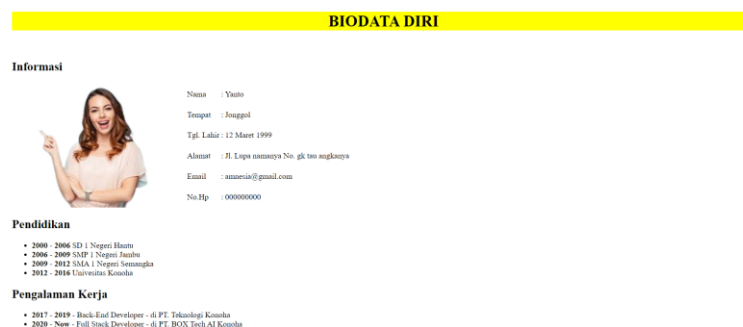
Gambar 3. Hasil Portofolio Sederhana.