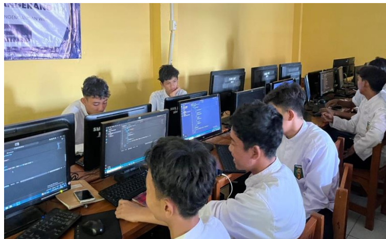
Gambar 4. Suasana saat siswa/i mempraktekan materi.

Kami harap kegiatan ini dapat terus dilanjutkan dan memberikan manfaat yang berkelanjutan sesuai dengan tujuan pengabdian masyarakat, yaitu mendukung peningkatan kompetensi dan pengetahuan di era digital.