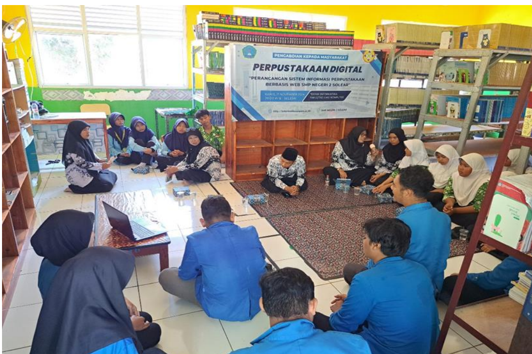
Gambar 3. Demostrasi Dan Pelatihan Terhadap Guru dan Siswa