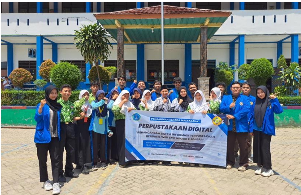
Gambar 4. Foto Bersama Guru dan Siswa SMPN 2 Solear

Program pengembangan sistem informasi perpustakaan ini dirancang untuk memberikan dampak jangka panjang bagi SMPN 2 Solear. Untuk menjamin keberlanjutan program, tim PKM telah menyusun panduan penggunaan sistem dan memberikan pelatihan komprehensif kepada staf perpustakaan. Selain itu, sistem juga dirancang dengan mempertimbangkan kemudahan pemeliharaan dan kemungkinan pengembangan di masa depan. Dokumentasi teknis yang lengkap telah diserahkan kepada pihak sekolah untuk memudahkan proses maintenance dan upgrade sistem bila diperlukan.