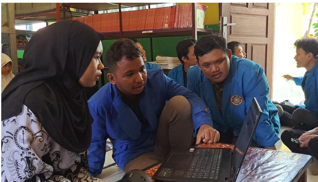
Gambar 2. Demostrasi Dan Pelatihan Terhadap Staff Perpustakaan