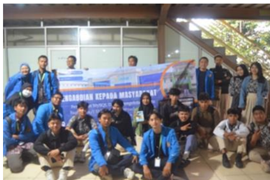
Gambar 4. Foto Bersama Peserta

Pada sesi praktik, siswa diajarkan membuat database mulai dari merancang struktur tabel, memasukkan data, hingga menggunakan perintah SQL sederhana seperti SELECT dan INSERT. Beberapa siswa mengalami kesulitan teknis seperti kesalahan penulisan sintaks SQL, namun mereka berhasil menyelesaikan tugas dengan arahan dari tim pelaksana. Hasil praktik menunjukkan siswa mampu membuat database sederhana yang relevan dengan kebutuhan praktis, seperti pengelolaan nilai dan absensi siswa.