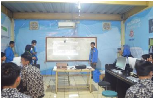
Gambar 2. Pemaparan Materi

Kegiatan ini berhasil melibatkan 35 siswa dari jurusan Teknik Komputer dan Jaringan (TKJ). PKM dilaksanakan dalam dua sesi utama: sesi teori dan sesi praktik pembuatan database menggunakan PHPMyAdmin.