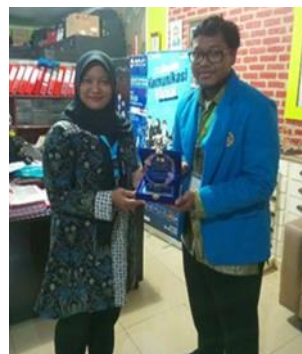
Gambar 5. Foto Penyerahan Plakat