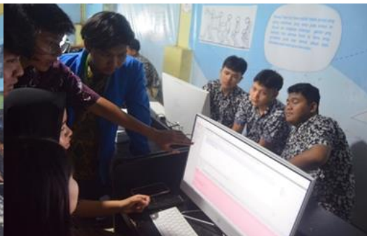
Gambar 3. Kegiatan Praktek