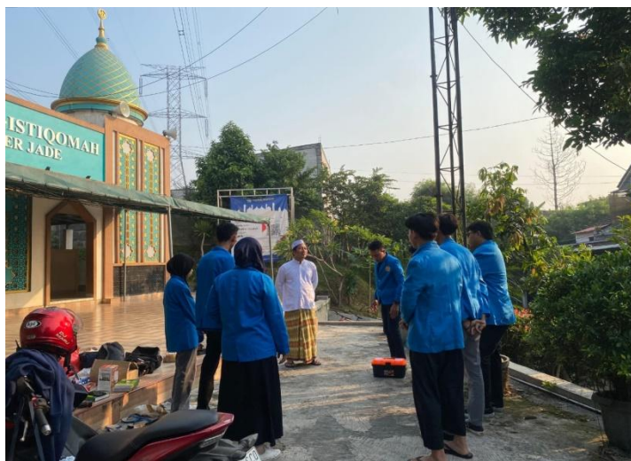
Gambar 1. Gambar ini mendokumentasikan momen sambutan dan briefing yang disampaikan oleh Dewan Kemakmuran Masjid (DKM) Masjid Al-Istiqomah Depok kepada tim pelaksana kegiatan Pengabdian kepada Masyarakat (PKM). Sambutan diawali dengan ucapan terima kasih dari

Dosen dan mahasiswa yang akan melaksanakan PKM, atas inisiatif sendiri ataupun untuk memenuhi permintaan dari luar yang tertuju kepadanya, perlu mengajukan surat pemberitahuan kepada ketua LPPM dengan sepengetahuan dan persetujuan ketua program studi dan rekan, dilengkapi dengan rencana kegiatan (proposal). Ketua LPPM menerbitkan surat tugas bagi dosen yang akan melaksanakan PKM. Setelah kegiatan selesai, dosen pelaksana PKM melaporkan hasil kegiatannya, disertai bukti-bukti fisik seperti presensi peserta, modul atau bukti-bukti lain. sesuai dengan jenis kegiatannya.