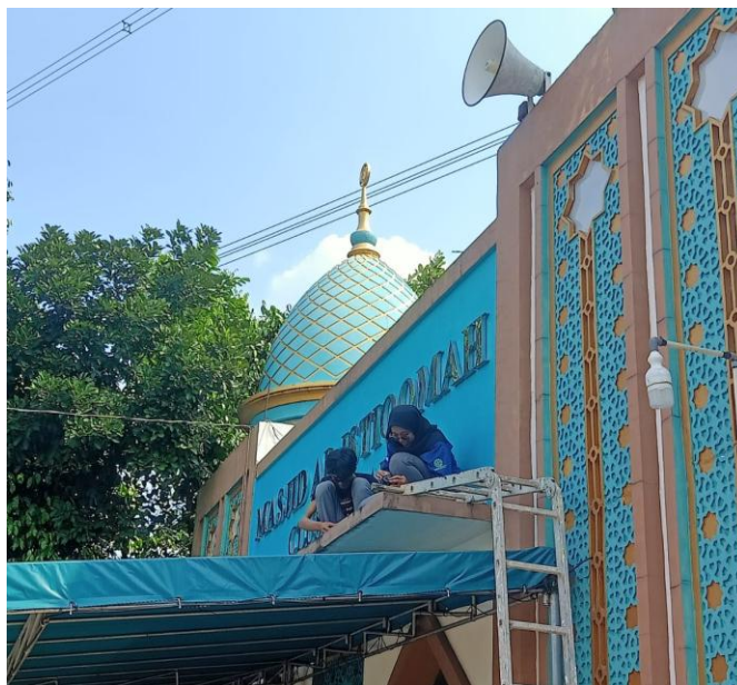
Gambar 6. Tim pengabdian kepada masyarakat (PKM) universitas Pamulang dalam gambar di atas yaitu kegiatan Penambahan lampu tembak di area tulisan Al-Istiqomah untuk Mendukung Aktivitas Ibad dengan Nyaman dan menambah estetika lingkungan masjid untuk menarik lebih banyak jamaah yang berkunjung dan beribadah.

risiko korsleting atau kerusakan kabel yang dapat terjadi akibat paparan air atau kelembapan tinggi di ruangan tersebut. Kegiatan dimulai dengan persiapan alat dan bahan, termasuk pipa fleksibel sebagai pelindung, kabel listrik, katek, serta alat ukur untuk memastikan pemasangan yang presisi. Setelah area pemasangan ditentukan, kabel yang sebelumnya terpasang langsung di atas pelapon dialihkan dan dimasukkan ke dalam pipa fleksibel. Tim bekerja sama untuk memotong pipa sesuai ukuran yang dibutuhkan, dan mengencangkannya ke dinding menggunakan klip penahan. Selama proses pemasangan, dilakukan pemeriksaan ulang untuk memastikan kabel berada di posisi yang aman di dalam pipa tanpa tekanan berlebih. Kegiatan ini memberikan manfaat signifikan dalam hal peningkatan keamanan listrik di lingkungan kamar mandi. Dengan adanya pipa isolasi, kabel lebih terlindungi dari potensi kerusakan fisik dan paparan air, sehingga mengurangi risiko kecelakaan listrik. Langkah ini juga menjadi solusi sederhana namun efektif yang dapat diadopsi secara luas di lingkungan rumah tangga maupun fasilitas umum lainnya.