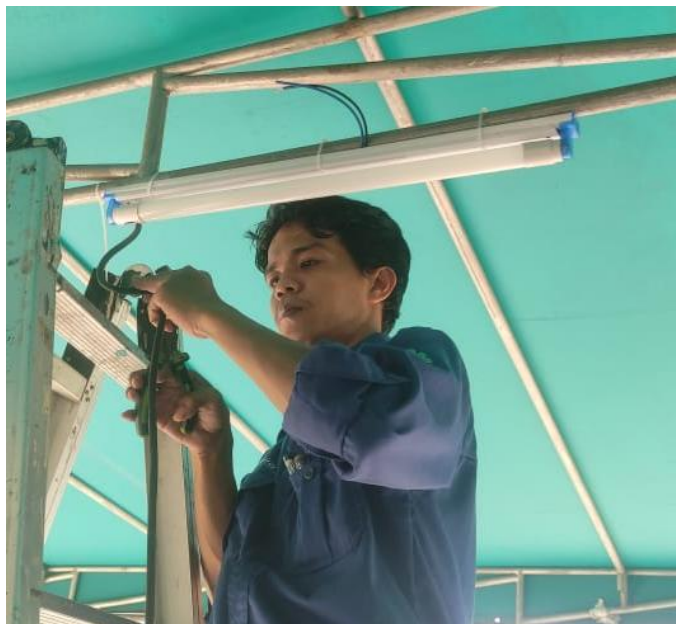
Gambar 7. Foto ini menunjukkan Tim Pengabdian Kepada Masyarakat (PKM) Universitas Pamulang yaitu sedang melakukan penggantian lampu TL di halaman Masjid. Tampak tim PKM sedang melakukan proses pemasangan lampu TL pengganti di area halaman masjid. Sebelumnya, lampu TL yang digunakan di halaman masjid memerlukan konsumsi energi yang tinggi dan pencahayaan yang kurang efisien. Dengan mengganti lampu-lampu tersebut dengan lampu TL yang lebih terang dan hemat energi, kami berharap dapat meningkatkan kualitas penerangan di area luar masjid, mengurangi pengeluaran biaya listrik, serta menciptakan suasana yang lebih nyaman dan aman bagi jamaah yang beraktivitas di malam hari.