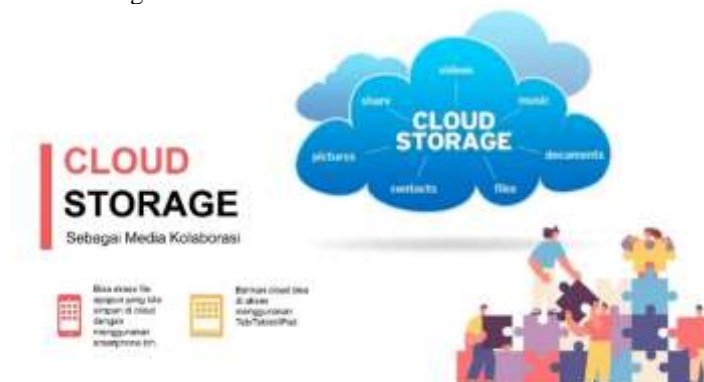
Gambar 2. Pengenalan Cloud Storage