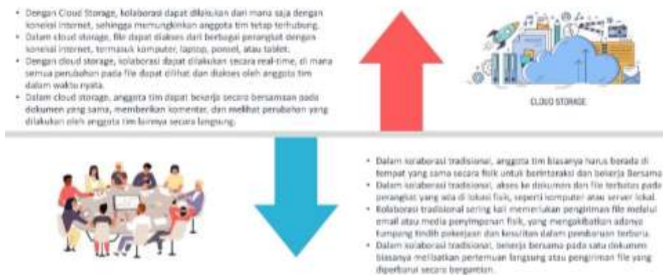
Gambar 4. Cloud Storage vs Tradisional