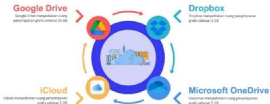
Gambar 6. Penyedia Layanan Cloud Storage