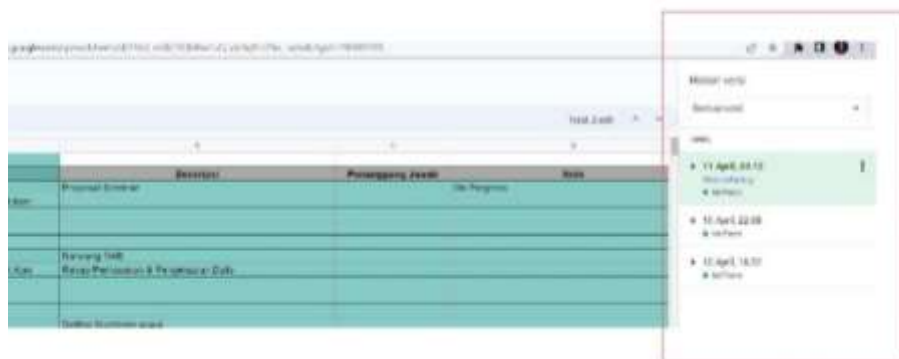
Gambar 5. Management Version Cloud Storage