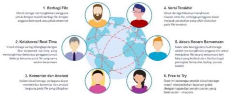
Gambar 3. Kolaborasi dengan Cloud Storage