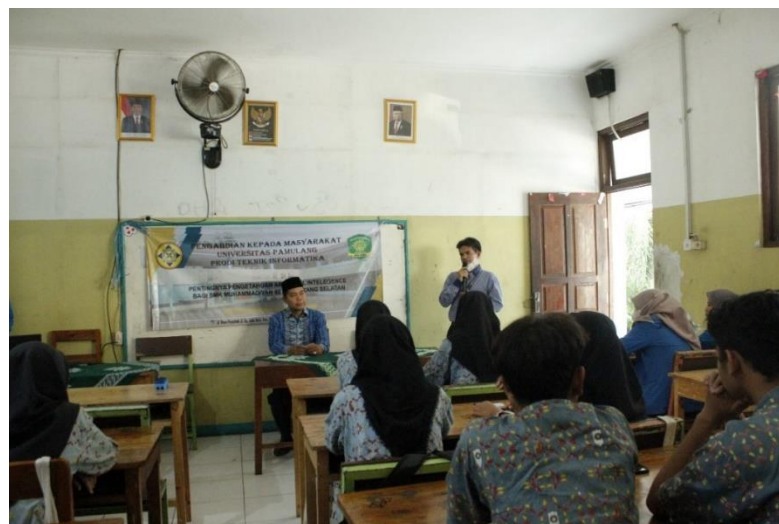
Gambar 3.2 Pembukaan oleh Dosen Pembimbing

Setelah itu dilakukan penyampaian materi tentang AI. Materi yang disampaikan adalah pengertian AI, pentingnya pengetahuan AI bagi siswa, peluang karir dibidang AI, dan lain-lain seperti pada gambar 3.3