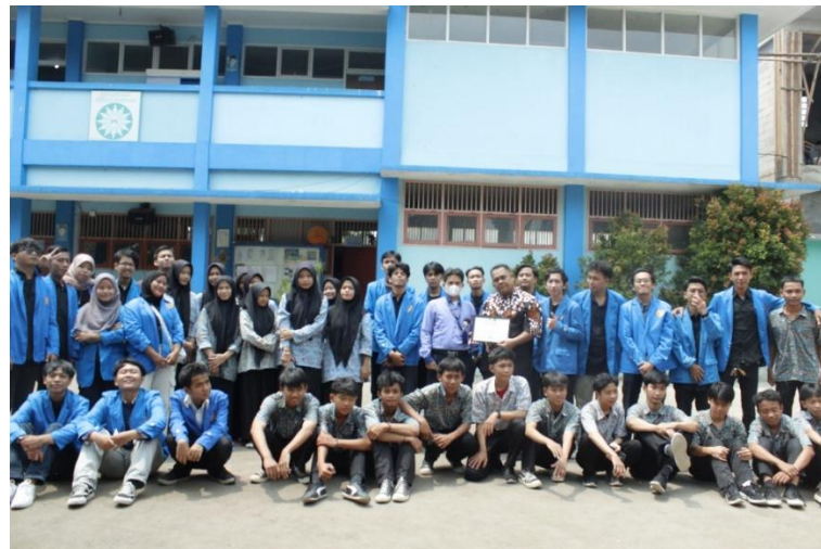
Gambar 3.6 Foto Bersama

Berdasarkan kegiatan PKM yang dilaksanakan di siswa SMK Muhammadiyah 02 seperti hasil diatas, para siswa dan siswi sangat menyambut dengan rasa penasaran dan perhatian yang tinggi. Mereka menyambut si pelaksana kegiatan maupun isi dari acara tersebut dengan semangat. Dengan dilakukannya Pengabdian Kepada Masyarakat ini para siswa dan siswi siswa SMK Muhammadiyah 02 menjadi paham dan tersadar dengan teknologi AI, sehingga mereka dapat mencari tahu lebih lanjut. Pada gambar 3.6 terlihat bagaimana pelaksana kegiatan dan para siswa dan siswi berfoto bersama di akhir kegiatan