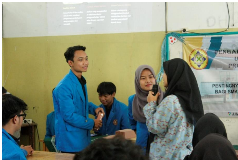
Gambar 3.4 Sesi Tanya Jawab

Sesi tanya jawab dilakukan dengan tujuan apabila ada siswa atau siswi yang belum memahami tentang apa yang disampaikan oleh pemberi materi seperti pada gambar 3.4