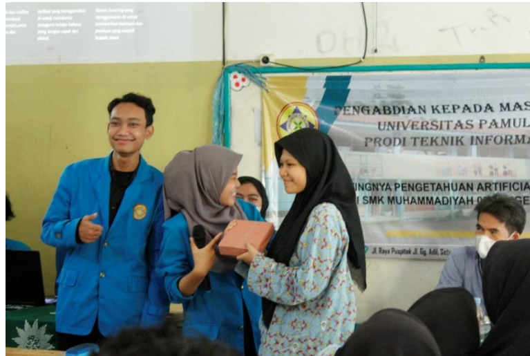
Gambar 3.5 Pembagian DoorPrize

Berdasarkan pemaparan materi dengan presentasi kepada siswa dan siswi SMK Muhammadiyah 02 Tangerang Selatan. Selama kegiatan berjalan, maka kegiatan pengabdian masyarakat ini memberikan hasil sebagai berikut :