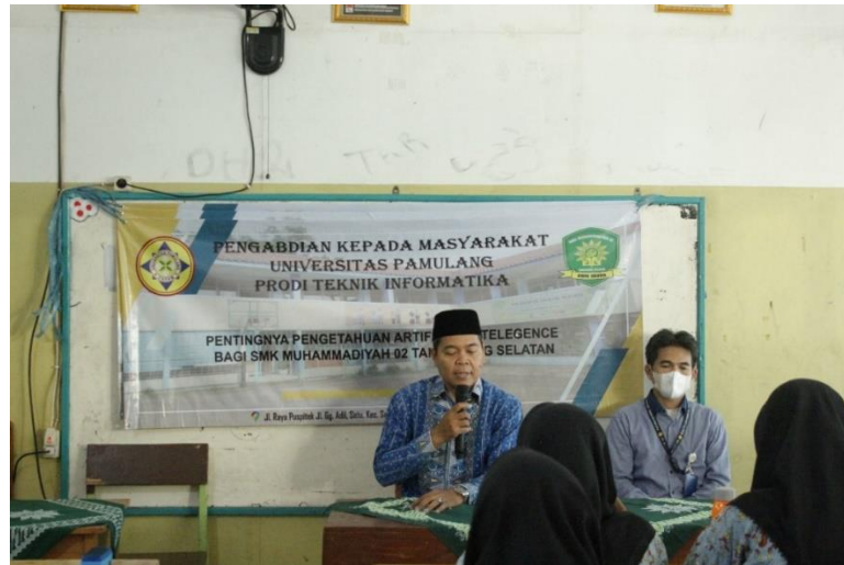
Gambar 3.1 Pembukaan oleh Kepala Sekolah

Sebelum melakukan pemaparan materi melakukan pembukaan oleh kepala sekolah dan dosen pembimbing