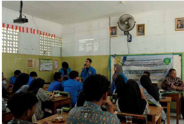
Gambar 3.3 Penyampaian Materi

Sesi tanya jawab dilakukan dengan tujuan apabila ada siswa atau siswi yang belum memahami tentang apa yang disampaikan oleh pemberi materi seperti pada gambar 3.4