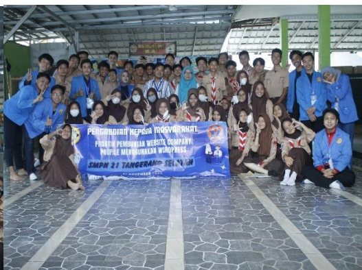
Gambar 3.6 Foto Bersama