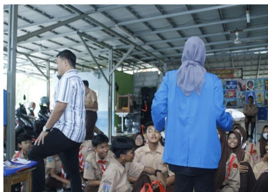
Gambar 3.5 Makan Bersama