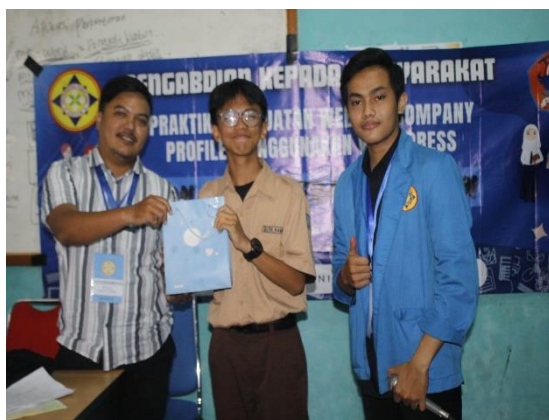
Gambar 3.3 Pemberian DoorPrize