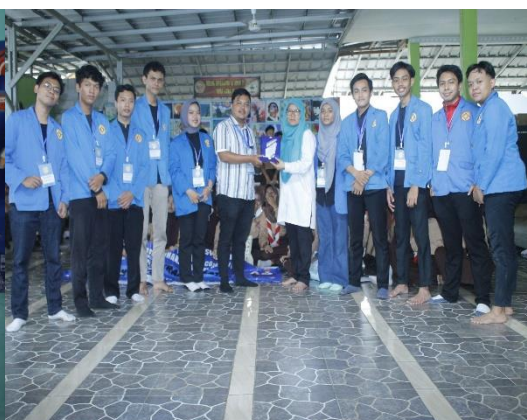
Gambar 3.4 Pemberian Plakat