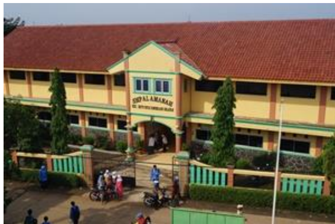
Gambar 1. Lokasi Gedung Bangunan Yayasan SMP Al-Amanah

Metode yang digunakan pada kegiatan ini berupa pelatihan aplikasi Canva. Pelaksanaan pelatihan menggunakan komputer dan laptop yang akan dilaksanakan di Lab Komputer SMP AL-Amanah dengan bimbingan dan pengawasan dari tim PKM. Pelatihan ini berupa presentasi, diskusi serta demonstrasi yang akan dilakukan oleh tim PKM.