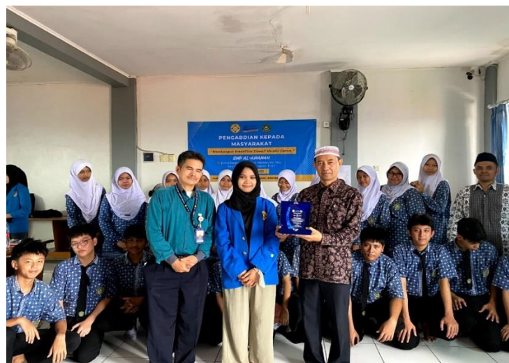
Gambar 4. Pemberian Plakat Kepada SMP Al-Amanah sebagai kenang-kenangan