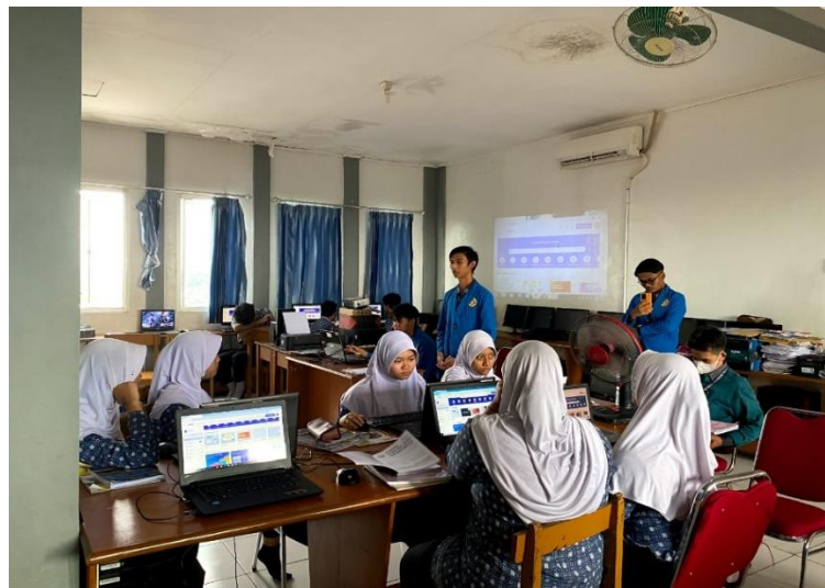
Gambar 3. Pelaksanaan Kegiatan Pengabdian Kepada Masyarakat