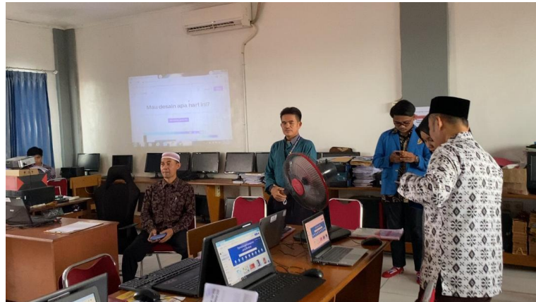
Gambar 2. Sambutan oleh Dosen Pembimbing Universitas Pamulang