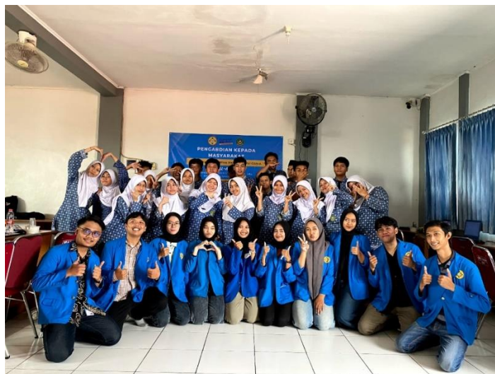
Gambar 5. Foto Bersama Mahasiswa Universitas Pamulang dan Siswa dan Siswi SMP Al-Amanah