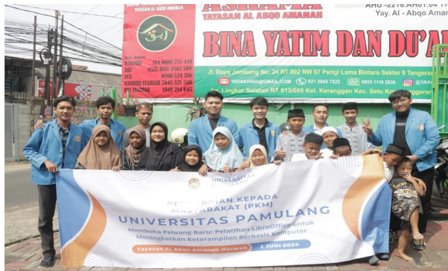
Gambar 1. Foto bersama

oleh anak asuh yayasannya. Diantaranya penjelasan mengenai Tools-tools dan format pembuatan dokumen pada Libre Office.